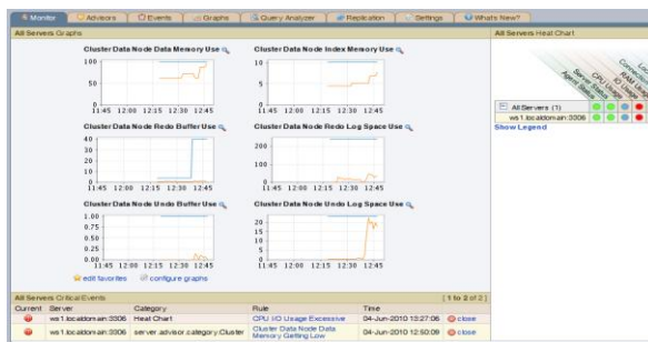
图 3. MySQL Cluster 专业顾问程序推荐最佳实践并降低停机风险

最终用户订购为期一年的服务即可获得 Oracle 标准 MySQL 支持服务。对于 ISV 和 OEM，标准支持服务可随商业许可一同购买。